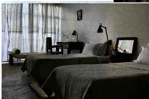
L'une des huit chambres au confort simple et sophistiqué. Et si le luxe était de se passer de télé...

L'agence VDM compte déjà dans son patrimoine le Steam Ship Sudan, bateau mythique qui navigue en Egypte sur le lac Nasser, un riad à Marrakech, une maison d'hôtes à Salvador de Bahia. Mais cette fois l'enjeu est différent. Il ne s'agit pas d'un énième hébergement original, voire décalé. On parle ici de préservation d'un bâtiment historique et d'une transformation exemplaire, saluée par un classement au patrimoine de la ville, qui fait fi de la rentabilité et des « business plans », d'une maison et d'un projet qui correspondent à la philosophie de l'entreprise tout comme elle peut répondre aux attentes de ses clients. Hormis couvrir les frais de fonctionnement, dont le salaire des 14 employés, rémunérés au-dessus des minima nationaux, les profits dégagés seront reversés à une association.